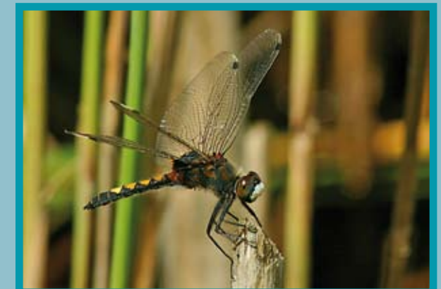
De gevlekte witsnuitlibel is de meest bijzondere libel in De Wyldemerk.

Onder deze soorten bevinden zich een flink aantal bijzondere en zeldzame soorten, waaronder de gevlekte witsnuitlibel die zelfs op Europees niveau beschermd is. Het gebied is zo aantrekkelijk voor libellen doordat kleine en grote venntjes elkaar afwisselen. Op en rond deze vennen is een rijke vegetatie aanwezig waardoor zowel de larven in het water als de volwassen libellen buiten het water voldoende beschutting kunnen vinden. Deze grote variatie van verschillende watertjes op een relatief klein oppervlak maakt het mogelijk om de libellen van dichtbij te bewonderen.