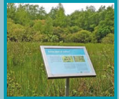
Een van de informatieborden in De Wyldemerk.

Waarom is nu juist De Wyldemerk is het eerste officiële libellenreservaat van ons land? In de Wyldemerk komen in totaal 35 soorten libellen voor: behoorlijk veel voor een gebied van deze grootte.