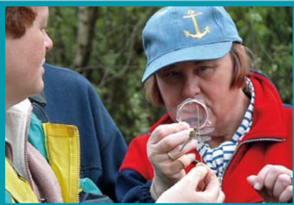
Libellen krijgen de volle aandacht.

De Wyldemerk is het allereerste libellenreservaat van Nederland. Als u op een mooie zomerdag door het gebied loopt zult u direct merken waarom. U zult zien dat er grote aantallen libellen met verschillende kleuren langs de waterkanten vliegen. De speciale libellenroute leidt u langs een aantal locaties waar u libellen kunt aantreffen. Op een zestal informatieborden wordt het fascinerende leven van deze prachtige dieren beschreven. U zult na deze wandeling een mooi beeld hebben gekregen van de pracht en praal die deze dieren en De Wyldemerk te bieden hebben.