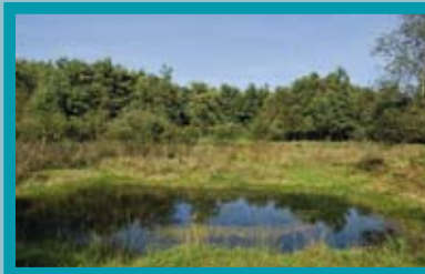
Soortenrijke poel in de Wyldemerk.

Libellen zijn bijzondere insecten. Als larve leven ze onder water. Nadat ze hier tot soms wel enkele jaren hebben doorgebracht, komen ze in het voorjaar of de zomer uit het water om te jagen en zich voort te planten. Aan het eind van het jaar gaan de meeste libellen dood. De larven en de eitjes zitten echter veilig onder water en vormen de nieuwe generatie van het volgende jaar.