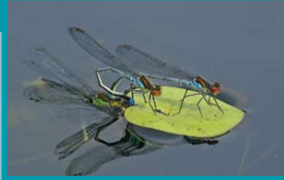
De voortplanting is een prachtig gezicht.

Libellen zijn bijzondere insecten. Als larve leven ze onder water. Nadat ze hier tot soms wel enkele jaren hebben doorgebracht, komen ze in het voorjaar of de zomer uit het water om te jagen en zich voort te planten. Aan het eind van het jaar gaan de meeste libellen dood. De larven en de eitjes zitten echter veilig onder water en vormen de nieuwe generatie van het volgende jaar.